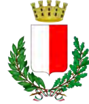
Comune di Bari