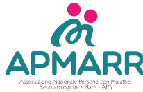
Associazione Nazionale Persone con Malattie Reumatiche e Rare - APS