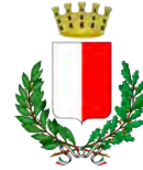
Comune di Bari