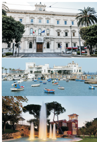
LEGENDA LUOGHI DELLA CONFERENZA